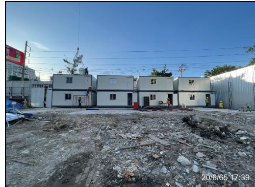
ภาพที่ 1.6-1 สถานภาพโครงการในปัจจุบัน